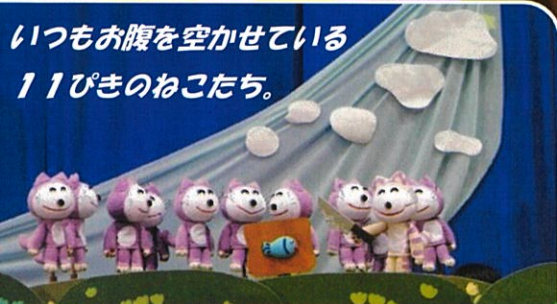
いつもお腹を空かせている 11ぴきのねこたち。