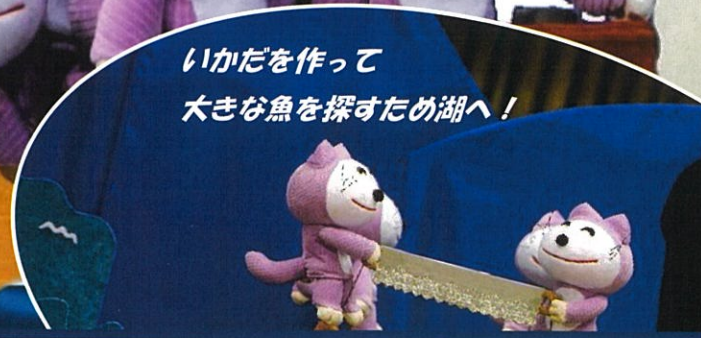
いかだを作って 大きな魚を探すため湖へ!